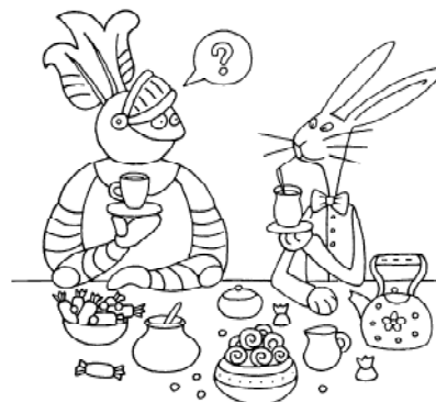
Был приглашён на чаепитие к Мартовскому Зайцу.

День 10-ый. Поехал на поезде покататься и в вагоне увидел своего знакомого: Грифона. Заговорили о прошедшем суде. Прочитав мой «Дневник», Грифон долго разбирался и в конце концов спросил об ответе кого-то из подсудимых . Я с трудом вспомнил, что этот подсудимый ответил: то ли «ДА», то ли «НЕТ» (сейчас я точно не помню, что я сообщил Грифону...). Получив